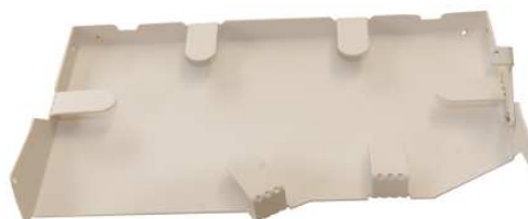
Skarvkassett 96 fiber