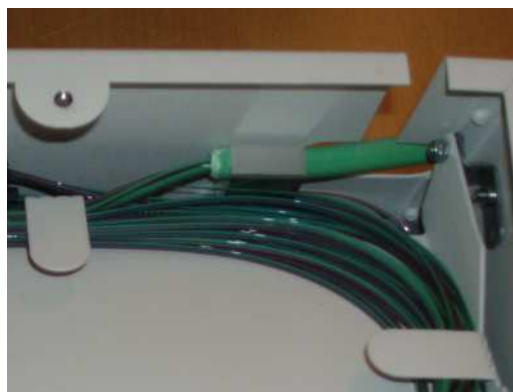
Infästning av kabel.

Kabeltyp som är anpassad för infästning i denna ODF-enhet är GAQQDBU/GAQDBU. Kabeln fästs in med bipackad kabelklämma. Kabelklämman är anpassad för kablar med diameter 7 mm (48-fibers box) eller 5/9 mm (96-fibers box). Används kabel med annan diameter så skall denna tejpas upp för att passa i kabelklämman.