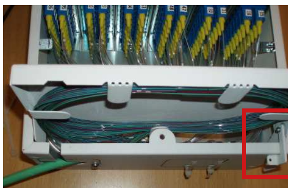
Skarvkassett kan fällas upp vid infästning av kabeln.

Vid infästning av kabeln kan skarvkassetten fällas upp och hålls på plats av kroken vid sidan.