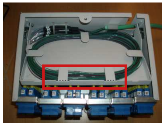
Placering av skarvhylsor

Skarvhylsorna placeras på motsatt sida av var fiberbanden kommer upp i kassetten. Skarvhylsorna ligger lösa i kassetten.