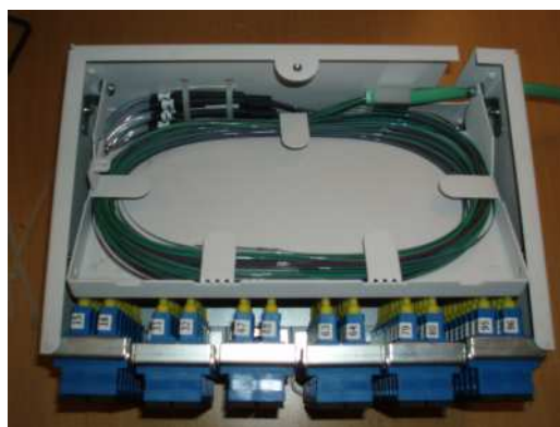
N3S ODF 96 med fan-out