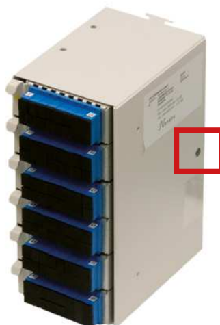
Skruv för öppning av ODF-box

Öppna ODF-boxen. Detta görs genom att skruva bort skruven på höger sida av boxen.