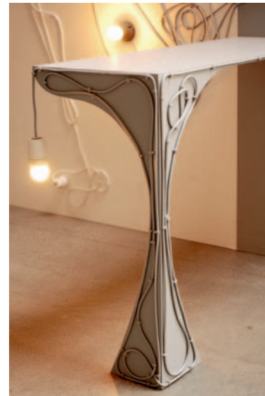
Funktion – dekoration. Detalj och bord.